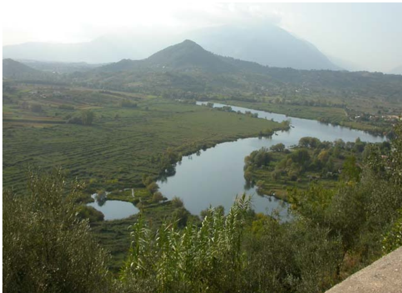
Der Regionalpark „Posta Fibreno“ in der Region Lazio/Italien.

Die wichtigsten Schlüsselpersonen in diesem Regionalpark werden von kleineren bis mittleren Unternehmen des Gebietes repräsentiert. Sie sind mit touristischen Dienstleistungen, Restaurants, Fischerei- und Reiseführergenossenschaften sowie Bootverleihe verbunden. Sie spielen eine direkte, aktive Rolle im Parkgeschehen.