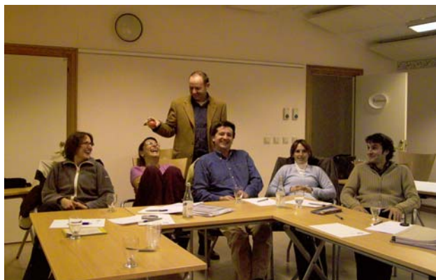
Erfolgsfaktoren für die Regionalentwicklung – Ein Ergebnis internationaler, freundschaftlicher Zusammenarbeit.

Für eine erfolgreiche Projektabwicklung sind daher unterstützende Instrumente notwendig. Eines davon wird in diesem Beitrag vorgestellt.