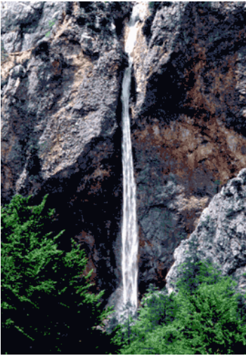
Der Rinka Wasserfall im Naturpark Logarska dolina.

Beschreibung: Starke Partner sind Gruppen mit sozialem, politischen und wirtschaftlichen Einfluss (z.B. Umweltschutz, Gastronomie, Landwirte, Tourismus, usw.). Starke Partner sind Schlüssel - Institutionen und NGOs, wie auch VIPs von außerhalb der Region. Sie sind sehr wichtig für den Umsetzungsprozess.