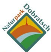
Kärntens 1. Naturpark

Der Naturpark Dobratsch ist Mitglied der Dachorganisation “Österreichische Naturparke” ( www.naturparke.at ). Das Marketing gliedert sich in zwei Ebenen. Beide Organisationen, der Naturpark Dobratsch und die Dachorganisation haben ein eigenes Logo und ihren eigenen Aufgabenbereich.