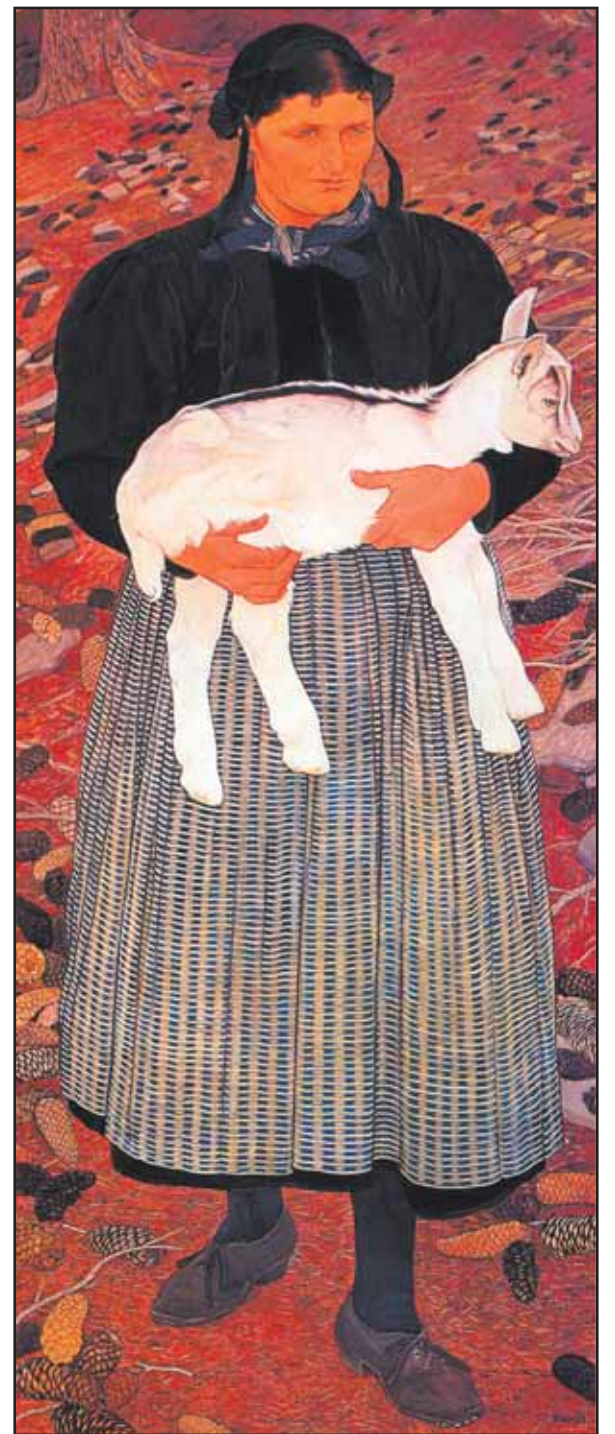
La dame au cabri. DR

bourgeoisie de Montana fait toujours partie de la Grande bourgeoisie, une entité historique issue de l'éclatement de la commune du Grand Lens en 1907. CHARLY ARBELLAY