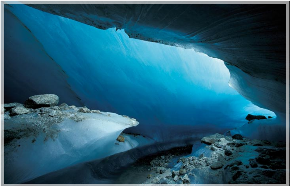
JAB Eishoehle Oberaletschgletscher

Alle ReferentInnen sind ausgewiesene Dozierende an Universitäten und Fachhochschulen. Zusätzlich werden Fachreferenten aus der beruflichen Praxis einbezogen.