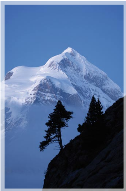
JAB Jungfrau hinteres Lauterbrunnental

Brock University, Department of Tourism and Environment, St. Catharines, Ontario, Canada