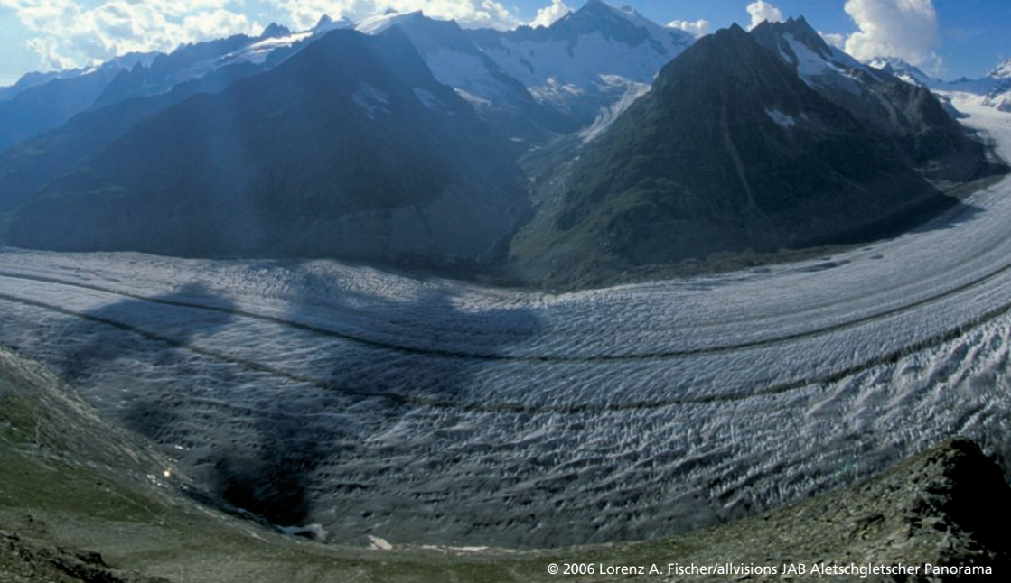
JAB Aletschgletscher Panorama