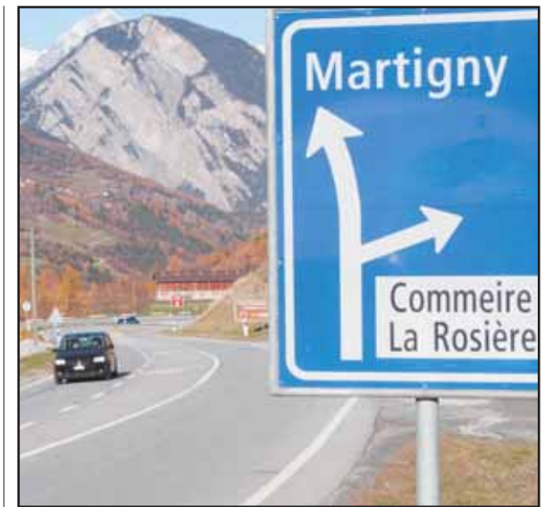
La sortie du grand virage dit de la gravière sera notablement améliorée et le carrefour pour Reppaz et Commeire modifié. LE NOUVELLISTE

nicipalité de reprendre financièrement une telle organisation, la question sera discutée en conseil. Nous allons de toute manière redynamiser la promotion économique et le tourisme dans le cadre de la prochaine répartition des dicastères.» Il précise aussi que le rapport Furger a servi à dresser un état des lieux sans concession. La proposition de développement de la télécabine? «Il y a aujourd'hui des réalités économiques qui rendent les contacts plus difficiles. Néanmoins la saison s'annonce bien. Il faut absolument réaliser un deuxième exercice positif pour pouvoir envisager de renouveler la concession d'ici à 2014.» Pour Roland Voeffray le tourisme est aujourd'hui le seul atout économique de la commune. «On ne peut rien développer d'autre. Et quelle que soit l'option qu'on choisit, il faudra de toute manière investir afin de doter la commune des infrastructures de base nécessaires, en termes de capacité d'accueil notamment. Malheureusement, la conjoncture actuelle n'est pas favorable.» En parallèle, Salvan veut continuer à développer l'habitat à l'année et les services liés. Et si la commune devait finalement renoncer à développer son tourisme? «On brandit toujours la menace d'une cité dortoir. Mais ça ne signifie pas pour autant un village mort.» cc