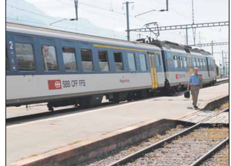
La réhabilitation de la gare CFF d'Ardon coûtera 6,3 millions de francs. BITTEL

► la route RC 74 Saxon - Sapin-haut: 3 millions de francs - dont 2,43 à charge du canton - doivent permettre d'adapter la chaussée au tissu construit. ► H144 Villeneuve - Les Evouettes: 2,6 millions sont débloqués pour que notre canton prenne en charge une partie du renchérissement.