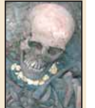
Détail de la tombe 18 que les députés ont pu découvrir.