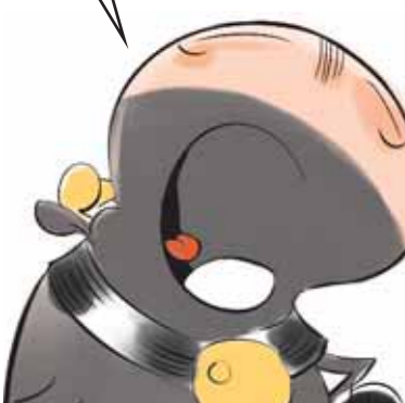
LA QUESTION VACHE A...

N'est-ce pas un peu mesquin que de vouloir augmenter les cotisations des salariés pour financer les allocations familiales?